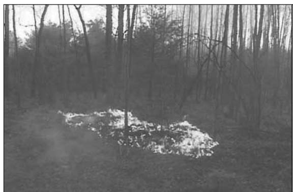
Figura 5. Las chispas pueden comenzar incendios nuevos.

Los incendios forestales y el calor que los mismos generan elevan las brasas ardientes en el aire y las mueven a favor del viento, creando incendios nuevos cuando las mismas aterrizan (Figura 5). Cuando estas brasas (también llamadas chispas) vienen de quemar árboles de hojas perennes, las mismas pueden moverse de 1/4 de milla a 1 milla con el viento. Un incendio forestal puede engendrar una ventisca de estas chispas, causando muchos incendios nuevos y agobiando rápidamente cualquier medida de control de incendios.