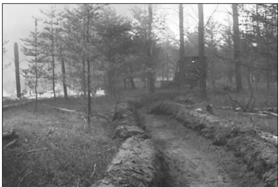
Figura 3. Amortiguador del combustible.

Los grandes incendios forestales pueden moverse rápidamente a través del campo, aunque no como una ola del mar, como a menudo se representa en los medios de comunicación. Un incendio forestal se mueve de punto a punto sobre el suelo a medida que sus requisitos de calor y combustible son alcanzados. Si un área no contiene combustible, el incendio no irá allí. Es por esto que los bomberos forestales típicamente controlan los incendios forestales quitando toda vegetación (combustible) y dejando solo la tierra mineral para crear un amortiguador del combustible. (Figura 3).