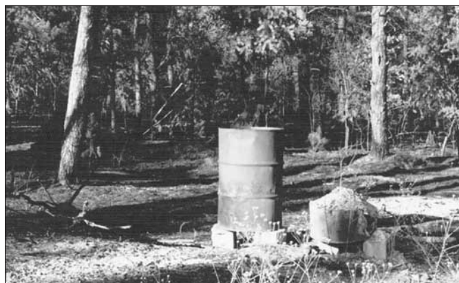
Figura 2. Un tercio de los incendios forestales en Michigan son causados por la quema de basura.

Los incendios forestales pueden empezar de muchas maneras, pero cerca del 98 por ciento de los incendios son causados por actividades humanas. Un tercio de todos los incendios forestales son causados por personas que queman basura (desechos de la casa y el jardín, Figura 2). La falta de atención por un momento o un cambio inesperado del clima pueden convertir rápidamente un incendio de basura en un incendio forestal. Una vez que comienza un incendio forestal,