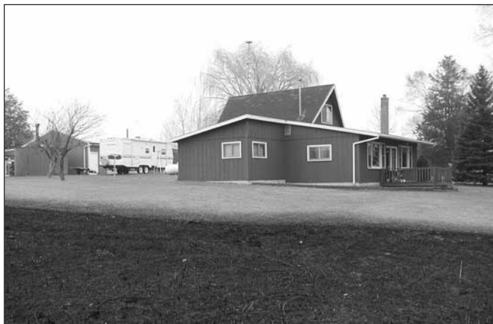
Figura 4. Los incendios forestales no pueden quemar donde no existe combustible.