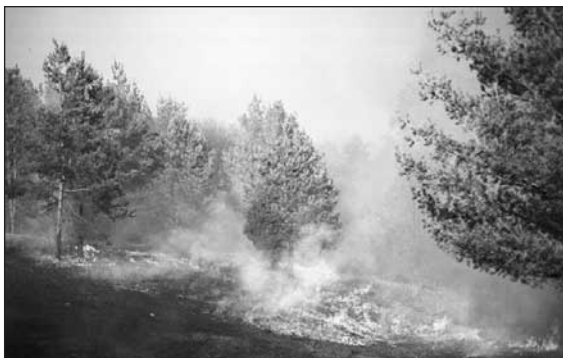
Figura 1. La mayoría de los incendios son pequeños y no llegan a cubrirse en las noticias.

Típicamente pensamos que los estados tales como Colorado, Arizona y California son propensos a experimentar incendios forestales. Pero Michigan experimenta un promedio de 8,000 a 10,000 incendios forestales cada año. La mayoría de éstos son incendios pequeños que no llegan a cubrirse en las noticias. (Figura 1). Pero aun estos incendios pequeños pueden dañar o destruir hogares y propiedades. Aproximadamente 100 hogares se pierden o son dañados cada año por incendios forestales en Michigan. Los incendios forestales ocurren en cada condado del estado. Según el Departamento de Recursos Naturales de